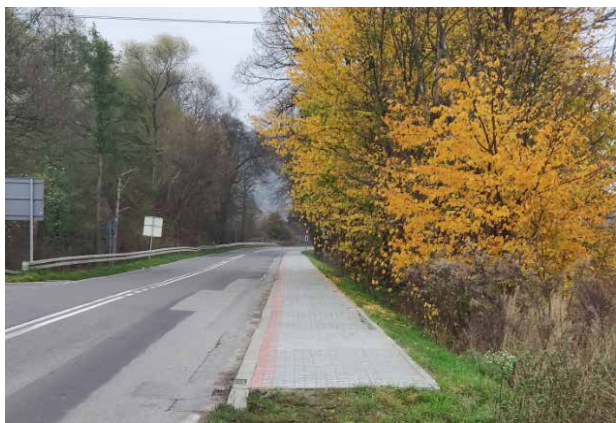
Chodnik w ciągu drogi publicznej gminnej ul. Oświęcimskiej w Wygielzowie

W listopadzie 2020r. zrealizowano inwestycję polegającą na zastąpieniu tłuczniowego pobocza chodnikiem z kostki brukowej wraz z niezbędną zmianą sposobu odwodnienia drogi na długości 194,00 mb. Wykonawcą robót było Przedsiębiorstwo Usługowo – Handlowo - Transportowe „WIKOS FRESH” Michał Strzelec, Wygielzów, ul. Adama Mickiewicza 72, 32-551 Babice. Koszt robót to: 37 800,00 zł .