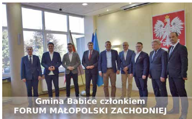
Gmina Babice członkiem FORUM MAŁOPOLSKI ZACHODNIEJ

Zgodnie z obowiązującym prawem każde stowarzyszenie musi posiadać swoją reprezentację i być zarejestrowane w sądzie. Podczas spotkania w dniu 15 września w Oświęcimskim Centrum Kultury zatwierdzony został statut stowarzyszenia, ustalona wysokość składek członkowskich oraz wybrane władze.