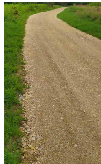
Remont drogi transportu rolnego zlokalizowanej na dz. nr 2506 w Zagórz

Przeprowadzony także został remont drogi transportu rolnego zlokalizowanej na dz. nr 2506 w Zagórz o powierzchni 900 m 2 dofinansowane w 50% ze środków z budżetu Województwa Małopolskiego związanych z wyłączeniem z produkcji gruntów rolnych. Całkowity koszt realizacji wyżej wymienionego zadania wyniósł: 45 730,17 zł , natomiast dofinansowanie było równe 22 865,00 zł .